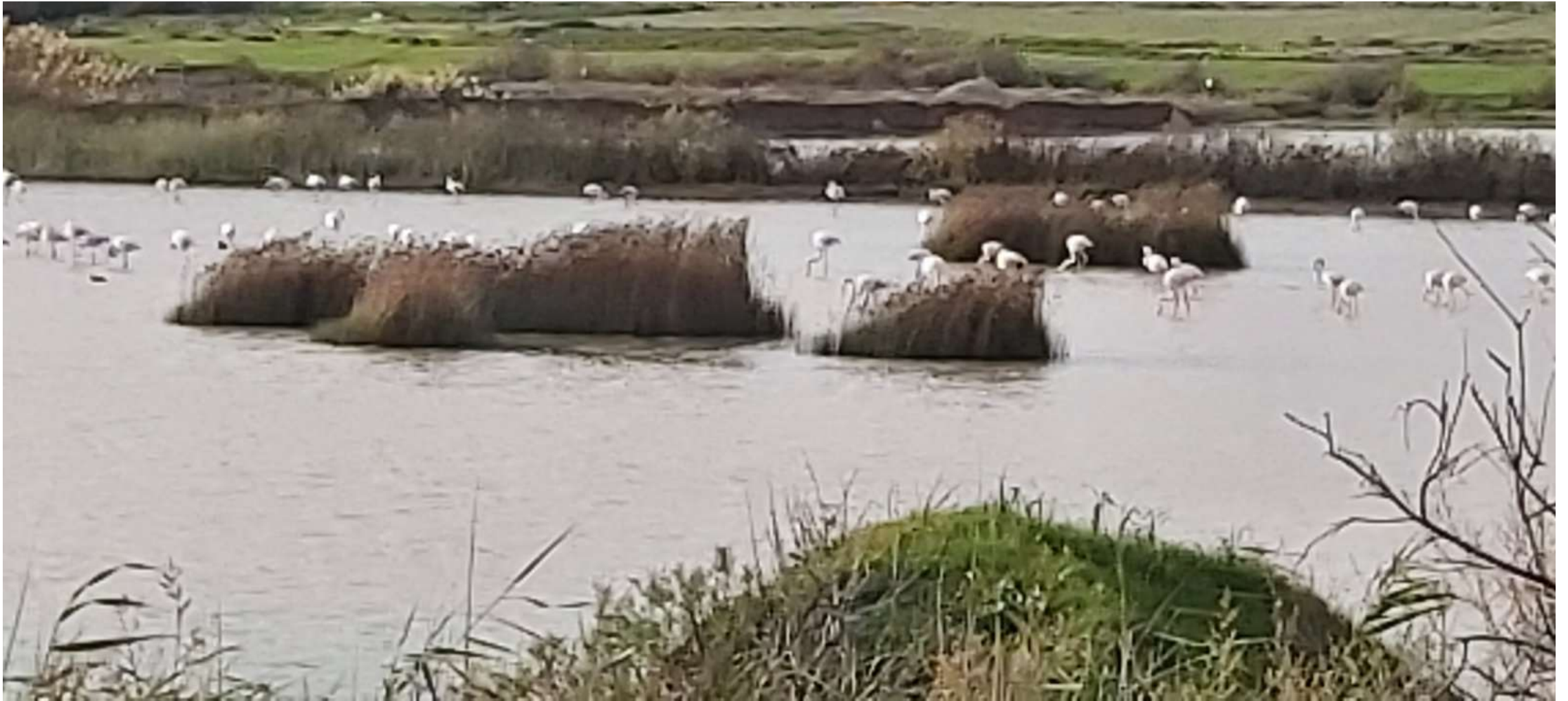
Τα φλαμίνγκο, οι χειμερινοί επισκέπτες στη Λίμνη Παραλιμνίου