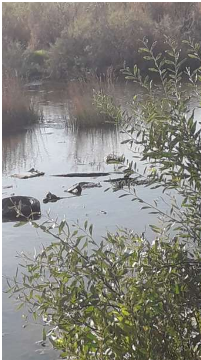
Η παρόχθια βλάστηση της Λίμνης Παραλιμνίου με την παρουσία σκουπιδιών